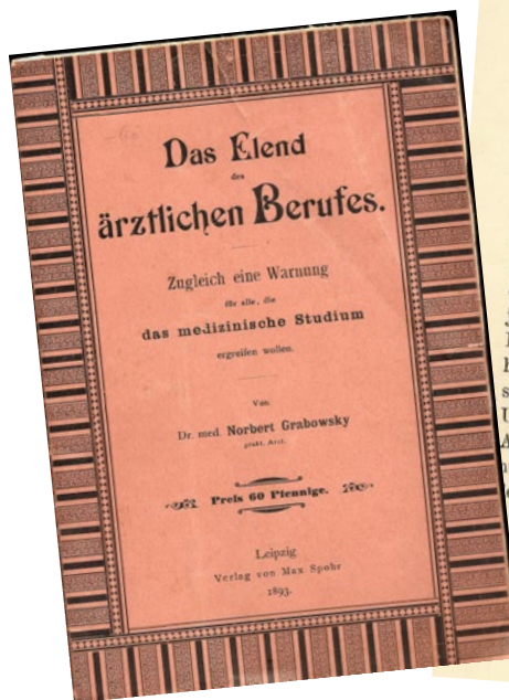
Abb. 1: Titel und Einleitung von Grabowskys 1893 erschienener Publikation „Das Elend des ärztlichen Berufes – Zugleich eine Warnung an die, die das medizinische Studium ergreifen wollen.“

„Die verkehrte Geschlechtsempfindung oder die Mannmännliche und weibweibliche Liebe“, die seinem Verleger Max Spor (1850–1905) eine Verurteilung wegen „Verbreitung unzüchtiger Schriften“ einbrachte (sehr viele interessante Informationen über den Verleger Max Spor bei Wikipedia).