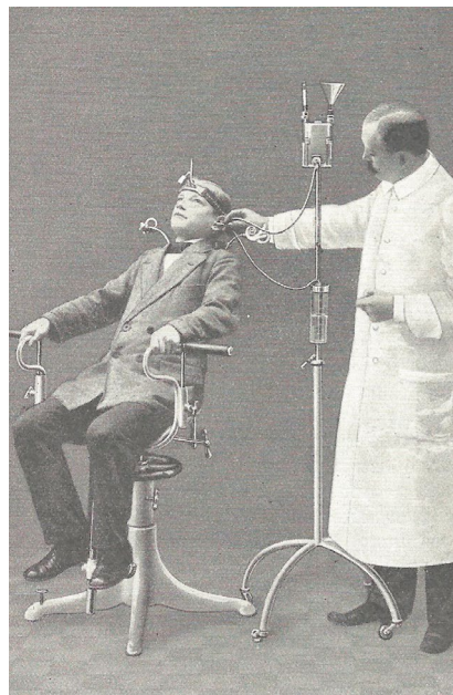
Abb. 4: Dreh- und Operationsstuhl nach Gustav Brühl